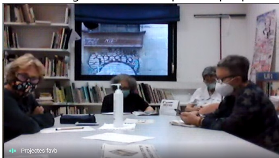
Imatge de la segona sessió del dia 30

Una vegada aprovat el primer esborrany del document en l'assemblea de la FAVB del 3 d'octubre es continuaran desenvolupant activitats per a aprofundir en el contingut del document i garantir la seva aplicació per part de les entitats.